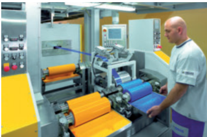
Abb. 6: Die Plasma-Feinstreinigung und Aktivierung sorgt für eine hohe Haftung des Lackauftrags auf den Aluminiumbändern.

Griesser entschloss sich, das Forschungsunternehmen Nanocraft mit einer Studie zum Thema «plasmabehandelte Aluminiumbleche» zu beauftragen. Als Ableger des Max-Planck-Institutes und unabhängiger Forschungsdienstleister ist Nanocraft mit aufwendig entwickelten Methoden aus der Rastersondenmikroskopie in der Lage, Oberflächen sowohl konventionell, d. h. topografisch elastisch, als auch chemisch sensitiv bis zur molekularen Auflösung abzubilden. Nanocraft führte die Prüfung der von Plasmatreteat entwickelten Systeme für die Reinigung und Aufbereitung der Aluminiumbahnen bei Griesser aus.