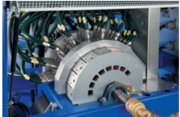
Abb. 7:

Plasmateat GmbH, Steinhagen Herr Joachim Schübler mail@plasmateat.de www.plasmateat.de