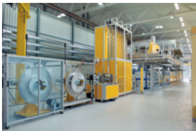
Abb. 1:

By means of a process unique anywhere in the world «Openair» atmospheric-pressure plasma technology has made the breakthrough in a Swiss coil coating plant of displacing all chemical precleaning processes and has established a role model in environmental protection.