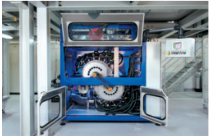
Abb. 5: Foto: Plasmatreteat Weltweit einzigartig ist der Einsatz von Plasma im Coil Coating Prozess. Die nur 2 m x 1.50 m große Plasmaanlage ersetzt eine 60 m lange Reinigungsstraße.

DAS ERGEBNIS. Unter Federführung von Nanocraft-Geschäftsführer Dr. Sabri Akari wurde die Anwendbarkeit von Atmosphären-Plasma in der Serienfertigung sowie seine Wirksamkeit bei der Vorbehandlung, d. h. der Reinigung und Aktivierung von zu lackierenden Oberflächen wie dem Coil Coating, nachgewiesen. Bei den Versuchen wurde die konventionelle chemische Vorbehandlung als Referenzsystem genutzt. Unter Berücksichtigung der zu optimierenden Material-Plasmaparameter (Plasmafokus, Intensität/Energieeintrag) konnte eine deutliche Überlegenheit gegenüber konventionellen Vorbehandlungsmethoden aufgezeigt werden: Die gewonnenen Ergebnisse bewiesen nicht nur